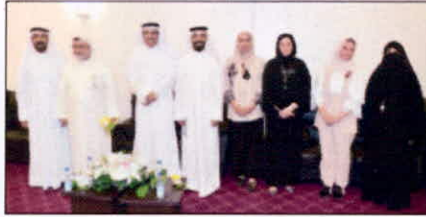
قياديو الكليات استقبلوا التهانى بدء العام الجديد

شهدت انطلاق الدراسة في كليات ومعاهد الهيئة العامة للتعليم التطبيقي والتدريب أمس لقاءات تنويرية للطلبة، وتبادل التهانى بين أعضاء هيئة التدريس، وسط حضور طلابي كبير، سواء من المستجدين أو المستمرين.