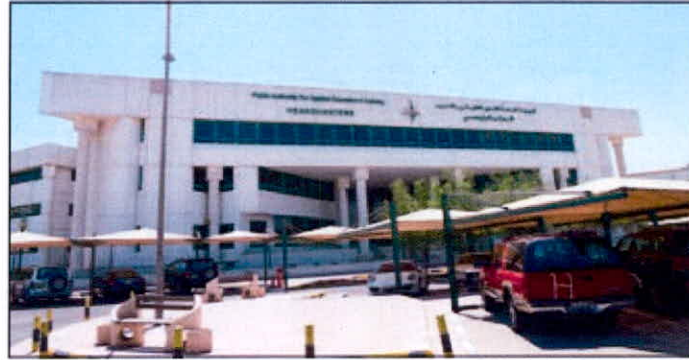
الازدحام في محيط مباني الهيئة كان سمة بارزة طوال يوم أمس

الدراسية على الرغم من اعتذار أعداد من أعضاء هيئة التدريس عن عدم الحضور عبر ملصق وضع على أبواب القاعات أو على مواقع التواصل الاجتماعي. وفي كلية الدراسات التجارية كان هناك إقبال كثيف من الطلبة حيث باشر الأساتذة تدريس المناهج الدراسية مع اليوم الأول في ظل تواجد كل موظفي إدارة الكلية لتقديم العون والمساعدة للطلبة فضلا عن حرص أعضاء هيئة التدريس على أخذ أسماء المتغيبين من الطلبة. وشهدت كلية الدراسات التكنولوجية في الشويخ حضور الطلبة لاستكمال جداولهم الدراسية وذلك نتيجة توصيات عمادة القبول والتسجيل في الكلية. بالضغط على الأقسام العلمية لفتح المزيد من الشعب الدراسية والسماح للطلبة بالتسجيل بها.