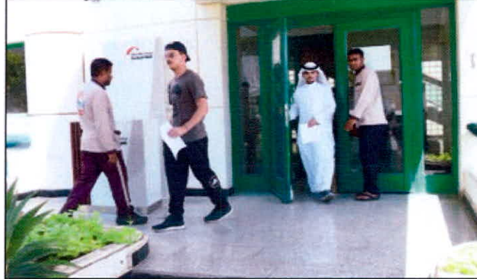
استكمال الجداول شغل طلاب «التطبيقي» في أول يوم للدراسة (المعد علي)

حضور ضعيف من القدامى.. وازدحام مروري بمحيط مباني الهيئة