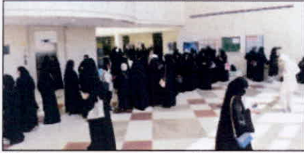
(تصوير ذابف العفلة)